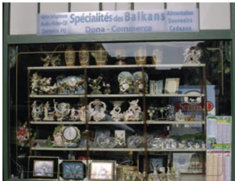
Rue du Maupas 42, à Lausanne.

que, qui présente, en langue française, les analyses de la presse démocratique des Balkans.