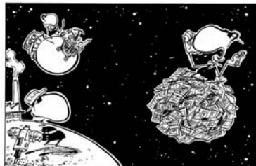
L'économie, l'affaire de chacun - Wirtschaft geht uns alle an

Département de l'Éducation, de la Culture et du Sport Département de l'Économie et du Territoire Délégué Ecole-Economie / www.ecole-economie.ch 9E1 l'économie dans tout ça ? Intégrer la dimension économique dans l'éducation en vue du développement durable Exposé HEP BEJUNE - Biemme - 24 septembre 2008