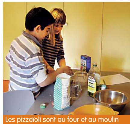
Les pizzaioli sont au four et au moulin

Quelques semaines après la réalisation du projet, au détour de la bibliothèque, l'enseignant surprend deux élèves absorbés dans leur réflexion: «C'est écrit dans ce livre que le thon rouge est menacé par la surpêche», relève l'un. «J'en avais déjà entendu parler», affirme l'autre. Et de s'inquiéter: «Tu te souviens si nous avons mis du thon rouge dans notre pizza?» Bien que terminé, le projet est toujours bien présent et anime les esprits des élèves qui semblent s'être totalement approprié la question. Un bel encouragement à poursuivre sur cette voie pour le futur enseignant, avec des projets qui impliquent les élèves et font sens pour eux. ●