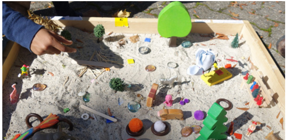
Conception d'une place de jeu idéale dans des bacs à sable.

Une réussite, fruit de la collaboration en réseau et de la participation de nombreux acteurs