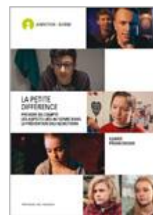
La petite différence Cycle 3, sec. II