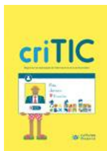
criTIC Cycle 3, sec. II