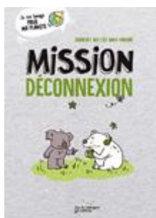
Mission déconnexion Cycle 2