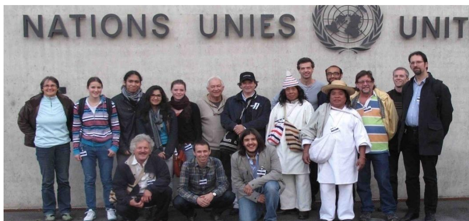
Begegnung mit den Angehörigen des indigenen Volkes Kogis (Kolumbien), Besuch der UNO mit Lehrpersonen und Schüler/-innen