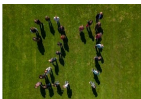
Team Réseau d'écoles21 avec tous et toutes les coordinateurs et coordinatrices cantonaux et régionaux