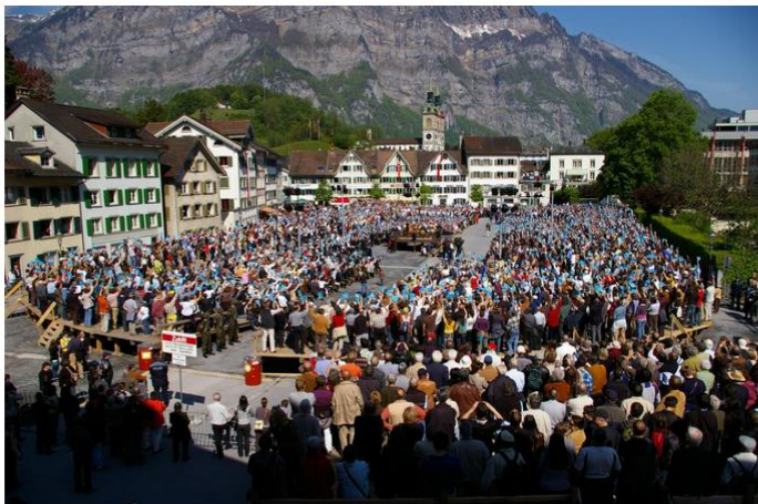
Immagine: Landsgemeinde glaronese di Marc Schlumpf www.icarus-design.ch

Nel mondo di oggi pieno di sconvolgimenti, è importante sapere chi ha o dovrebbe avere influenza sugli eventi privati e sociali, dove e in quale forma. Questo porta al centro la questione della partecipazione politica. Democrazia significa governo del popolo e si basa sulla partecipazione del maggior numero possibile di persone. In Svizzera, abbiamo un numero relativamente grande di diritti nelle elezioni e nei referendum. Ma anche nel nostro paese, la democrazia a volte raggiunge i suoi limiti, per esempio quando si tratta della questione di chi può usufruire di questi diritti. Insieme ai temi delle attuali proposte di voto, queste sono domande appassionanti che possono essere affrontate con profitto in classe.