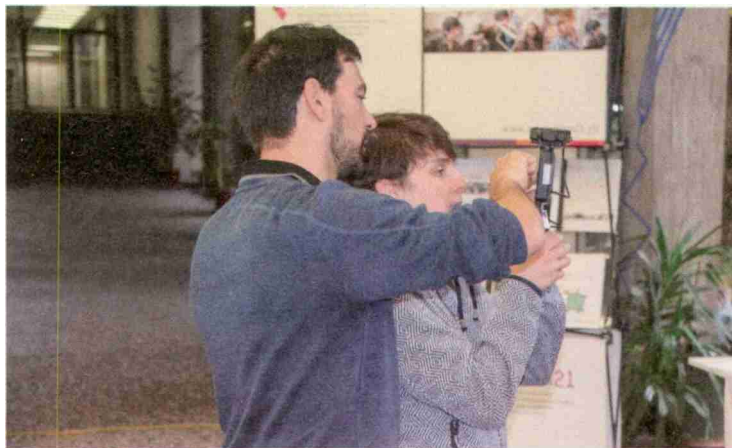
Les Rencontres romandes en éducation en vue d'un développement durable, que la HEP-BEJUNE a accueillies en 2019 sur son site de Bienne.

réfléchie, coordonnée et intégrative. Mon activité consiste également à encourager et à soutenir des initiatives individuelles ou institutionnelles. Avec notre responsable informatique, nous avons par exemple produit un document portant sur l'informatique durable. Plus concrètement, il s'agit de freiner le changement planifié du matériel informatique et de lui trouver une seconde vie. Enfin, j'assure la gestion de la commission consultative pour la durabilité, qui siège une dizaine de fois par année. La multiplicité des profils présents dans cette commission apporte une grande variété de points de vue, permettant une étude large des questions de durabilité. En ce moment, nous travaillons tout particulièrement à la mise en place d'un important plan de mobilité durable.