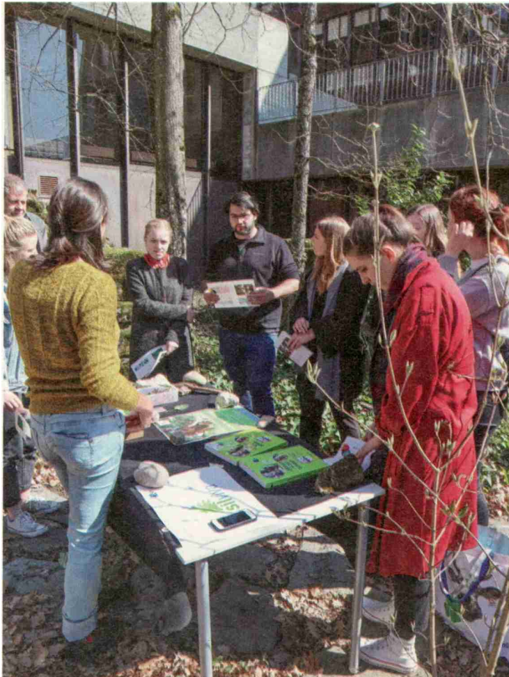
Présentation de la Fondation SILVIVA dans la cour intérieure du site de Bienne en 2019 lors du Forum de formation générale à l'intention des étudiantes et des étudiants en formation primaire.