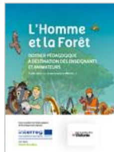
L'homme et la forêt Cycle 2