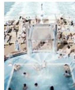
All Inclusive Cycle 3, sec. II