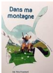
Dans ma montagne Cycles 1 et 2