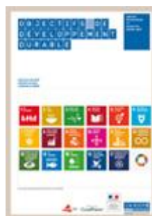
Objectifs de développement durable Cycle 3 à sec. II