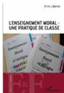
L'enseignement moral Cycles 1 et 2