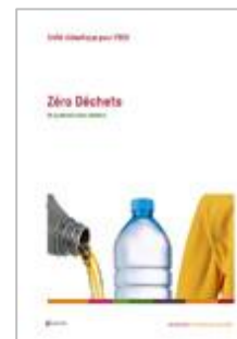
Zéro déchets - Un quotidien sans déchets Cycle 3 à sec. II