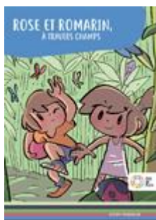
Rose et Romarin à travers champs Cycle 2